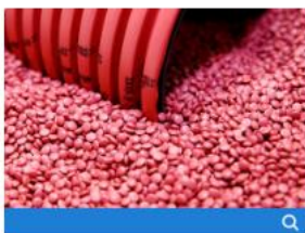
Materias primas y auxiliares