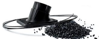
LUVOCOM® 3F PAHT CF