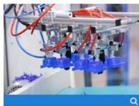
Máquinas y equipos