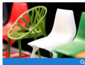
Productos semiacabados, Piezas técnicas, Productos de plástico reforzado