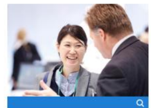
Servicios, Investigación, Ciencia